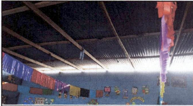
Foto1: Techo de aula de Preparatoria en mal estado